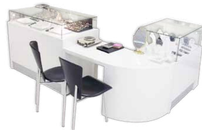
Comptoir vitrine + Caisse