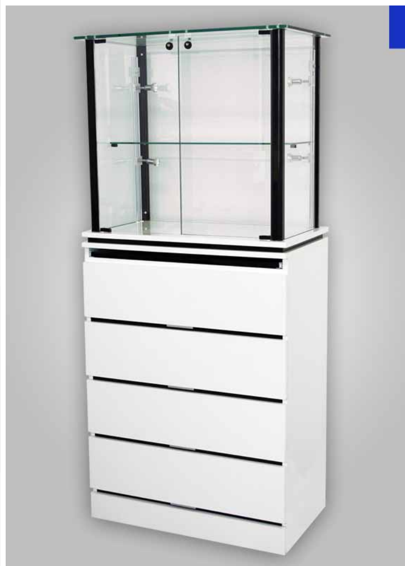
Vitrine haute avec meuble