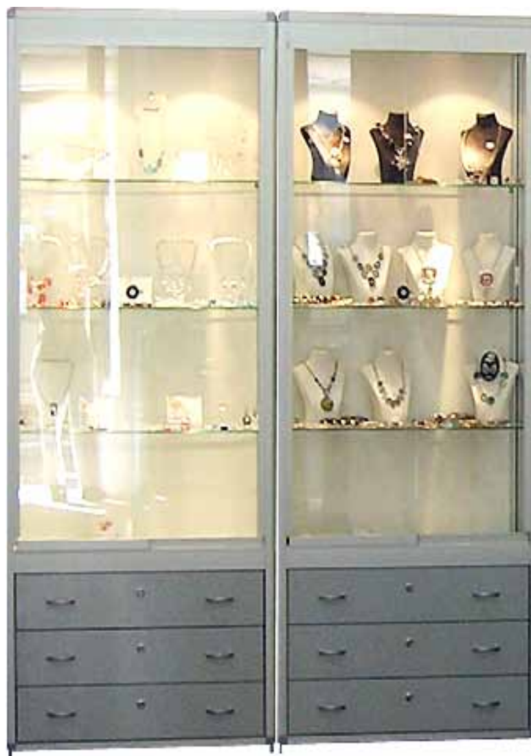
Vitrine haute avec meuble