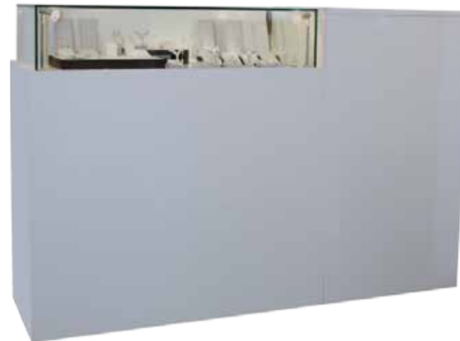
Comptoir vitrine + Caisse