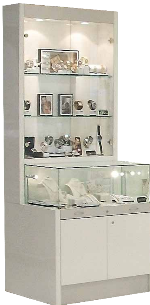
Vitrine haute avec meuble