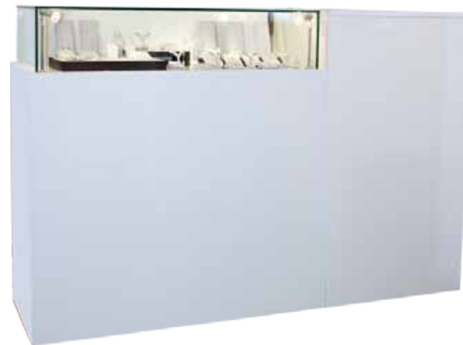
Comptoir vitrine + Caisse